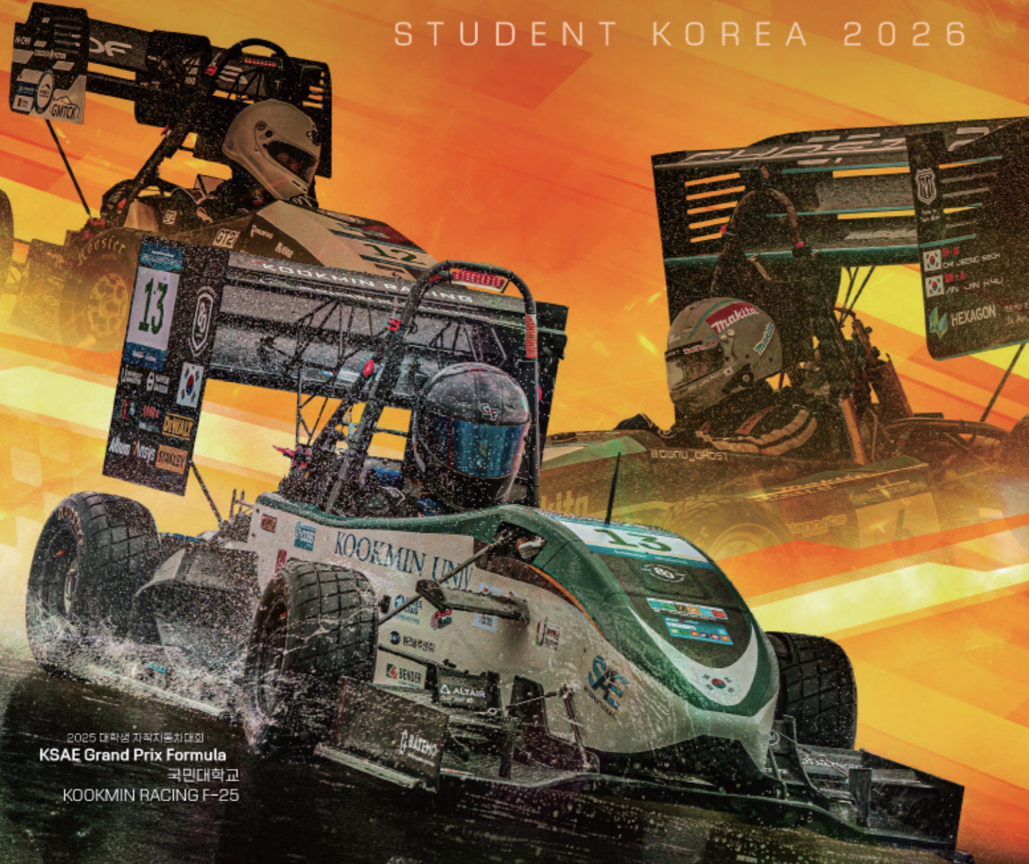
2025 대학생 자작자동차대회 KSAE Grand Prix Formula 국민대학교 KOOKMIN RACING F-25

2026.08.27. (목) - 30. (일) | 한국자동차연구원 E-모빌리티 연구센터